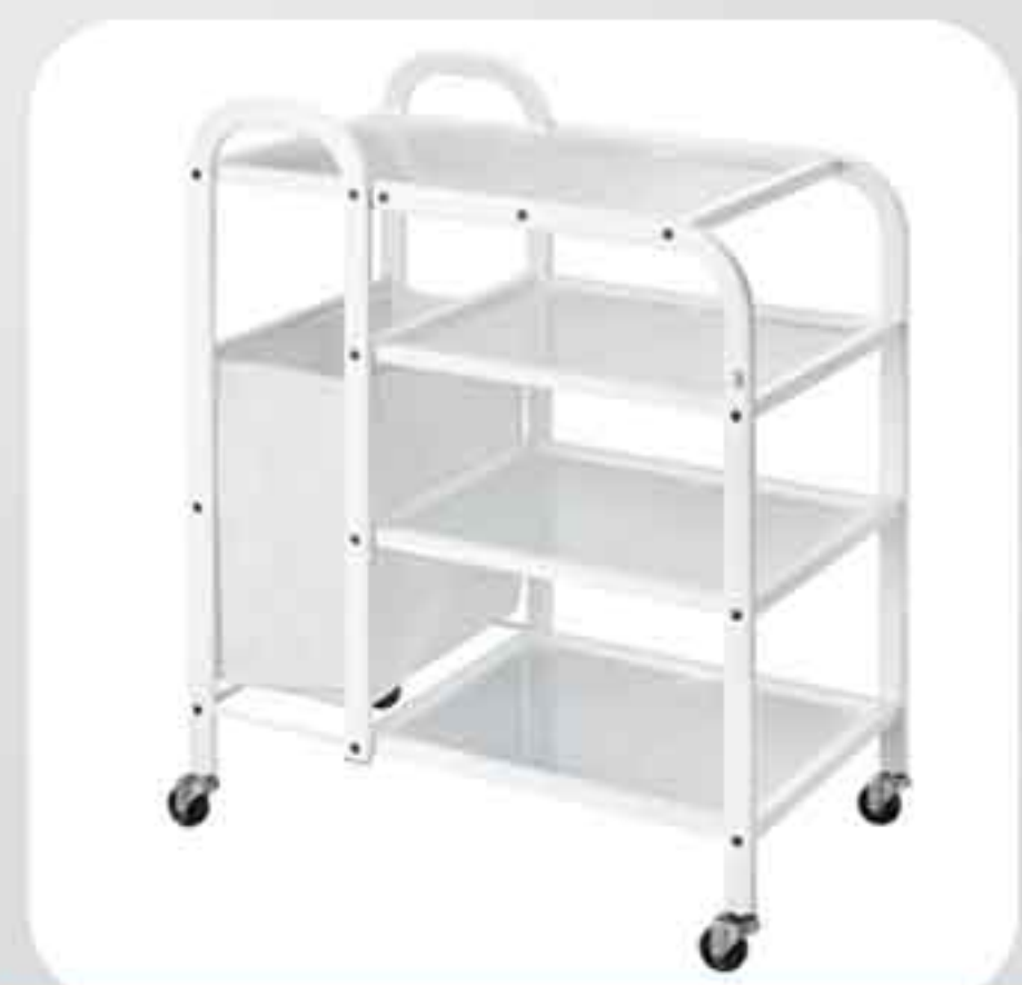
ΤΡΑΠΕΖΑΚΙ ΤΡΟΧΗΛΑΤΟ 1031