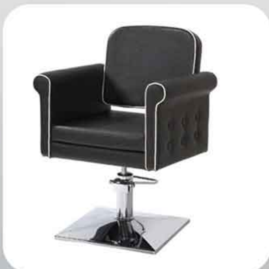
ΠΟΛΥΘΡΟΝΑ ΚΟΜΜΩΤΗΡΙΟΥ 6299-V5