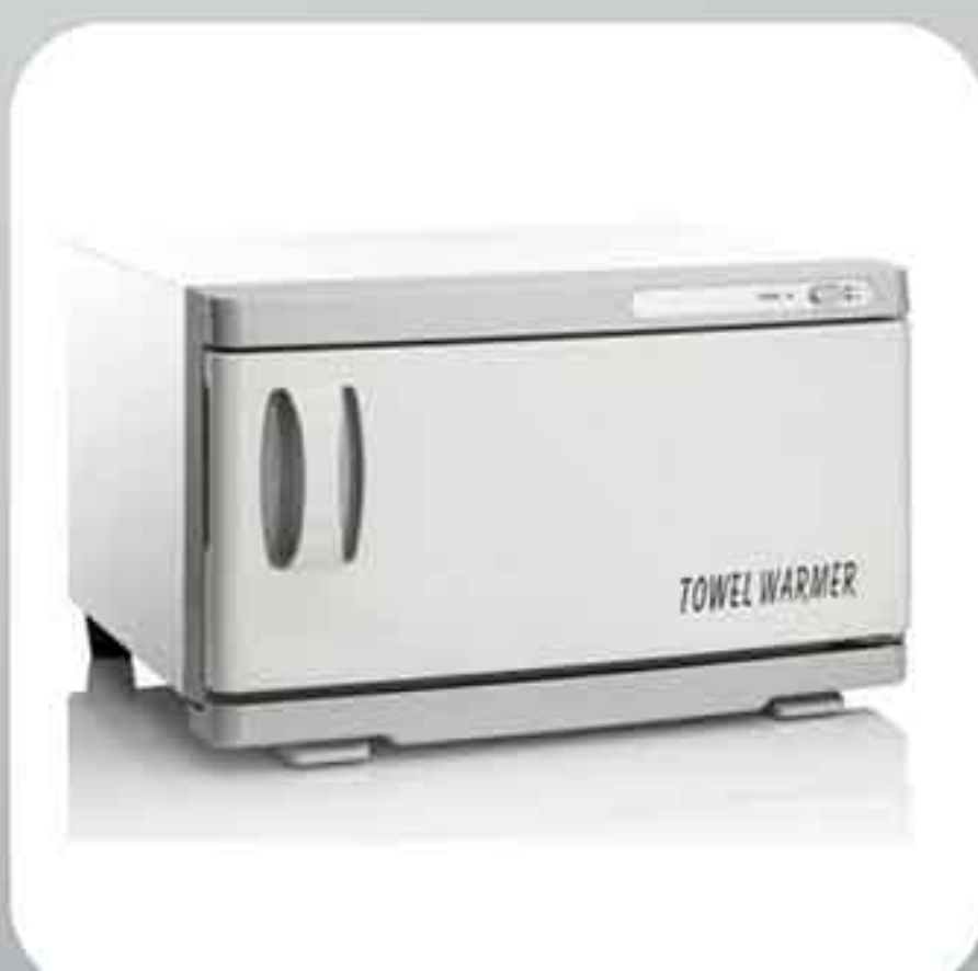
ΣΥΣΚΕΥΗ ΘΕΡΜΑΝΣΗΣ ΠΕΤΣΕΤΩΝ 370.008