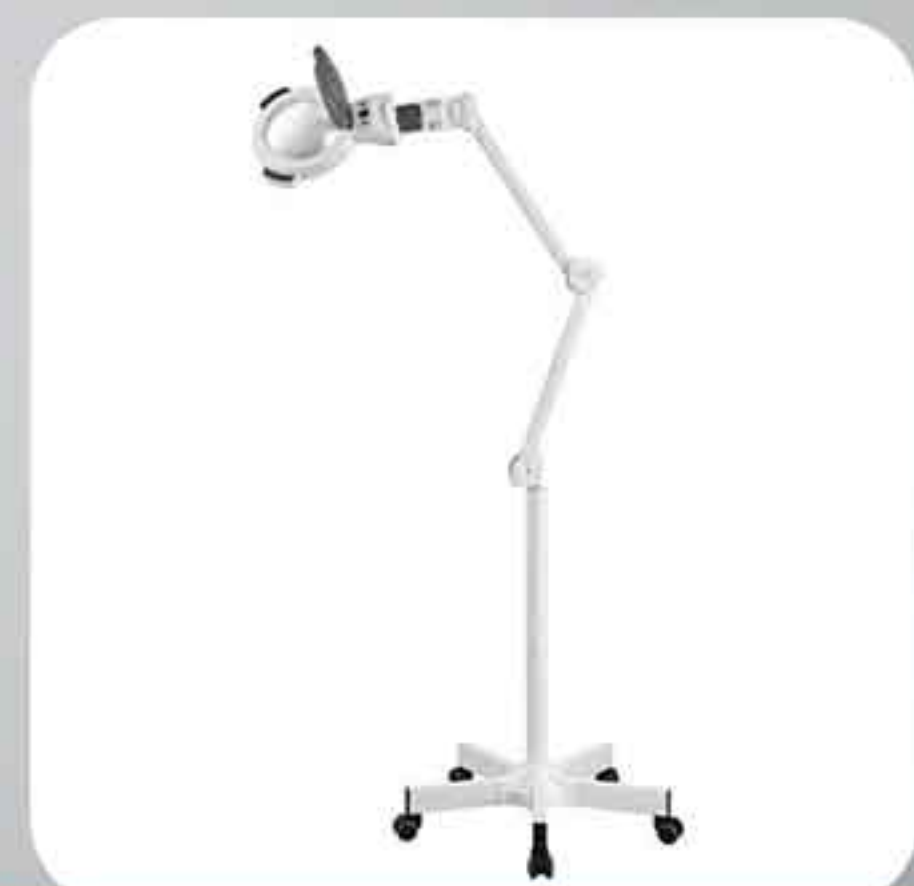
ΦΑΚΟΣ LED 1006A