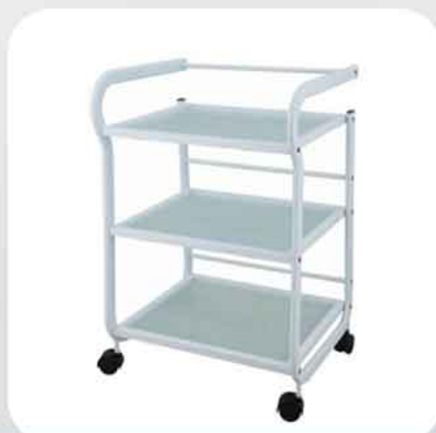
ΤΡΑΠΕΖΑΚΙ ΤΡΟΧΗΛΑΤΟ 3 ΡΑΦΙΑ 1013