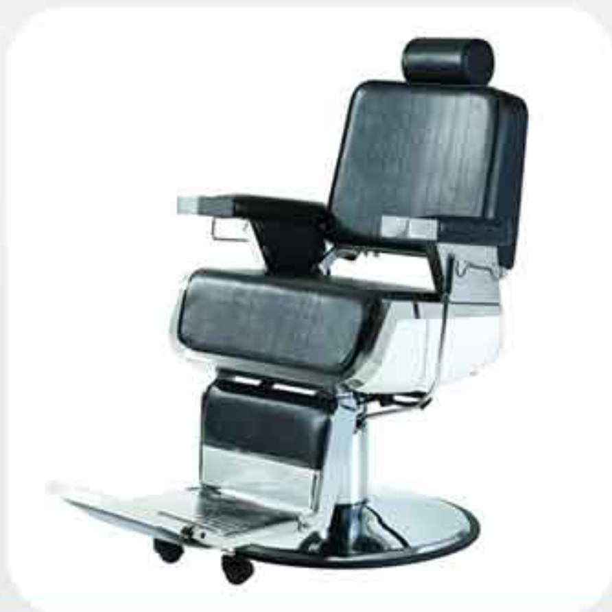
ΠΟΛΥΘΡΟΝΑ BARBER 31819-E