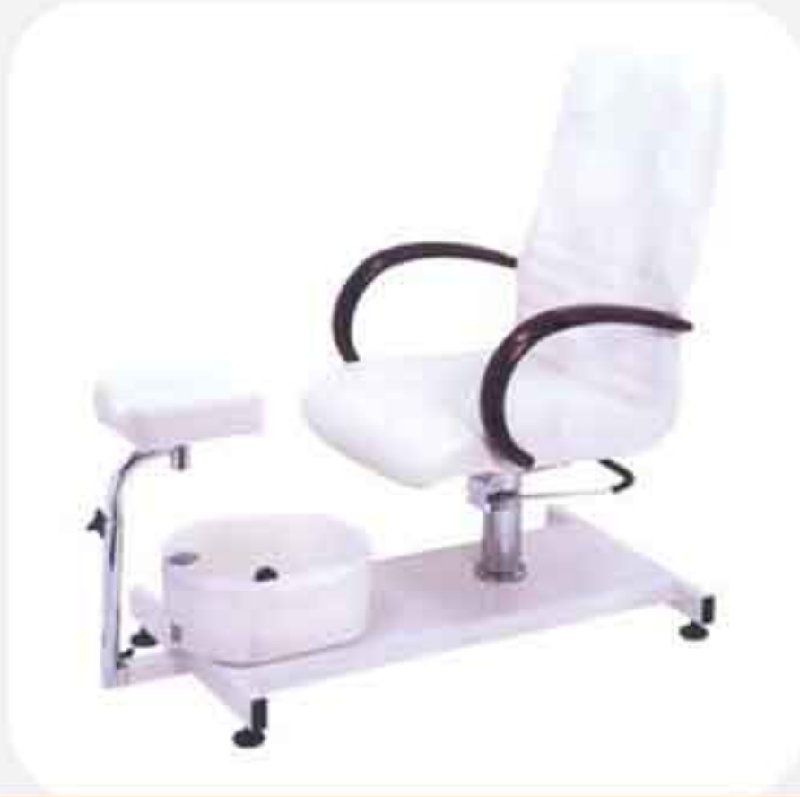
ΠΟΛΥΘΡΟΝΑ ΠΕΝΤΙΚΙΟΥΡ ΜΕ ΥΠΟΠΟΔΙΟ 6820