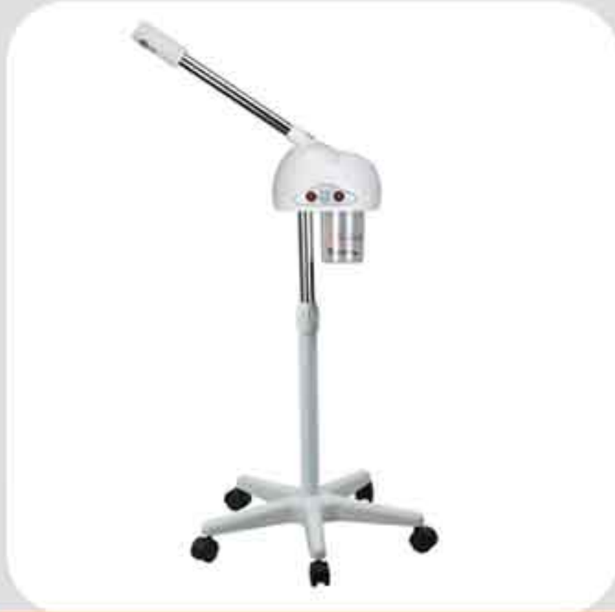
ΒΑΡΟΡΙΖΑΤΟΡ ΜΕ ΒΑΣΗ B-002