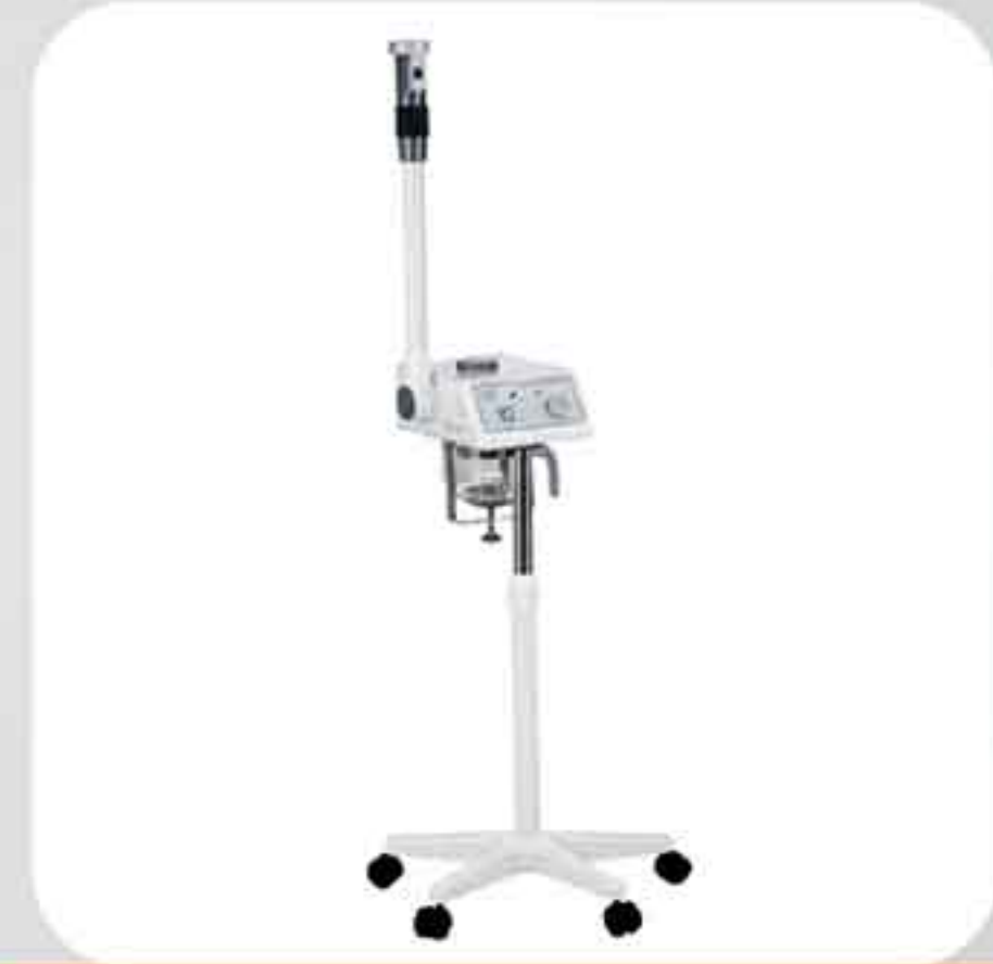
ΒΑΡΟΡΙΖΑΤΟΡ ΜΕ ΒΑΣΗ F-300B