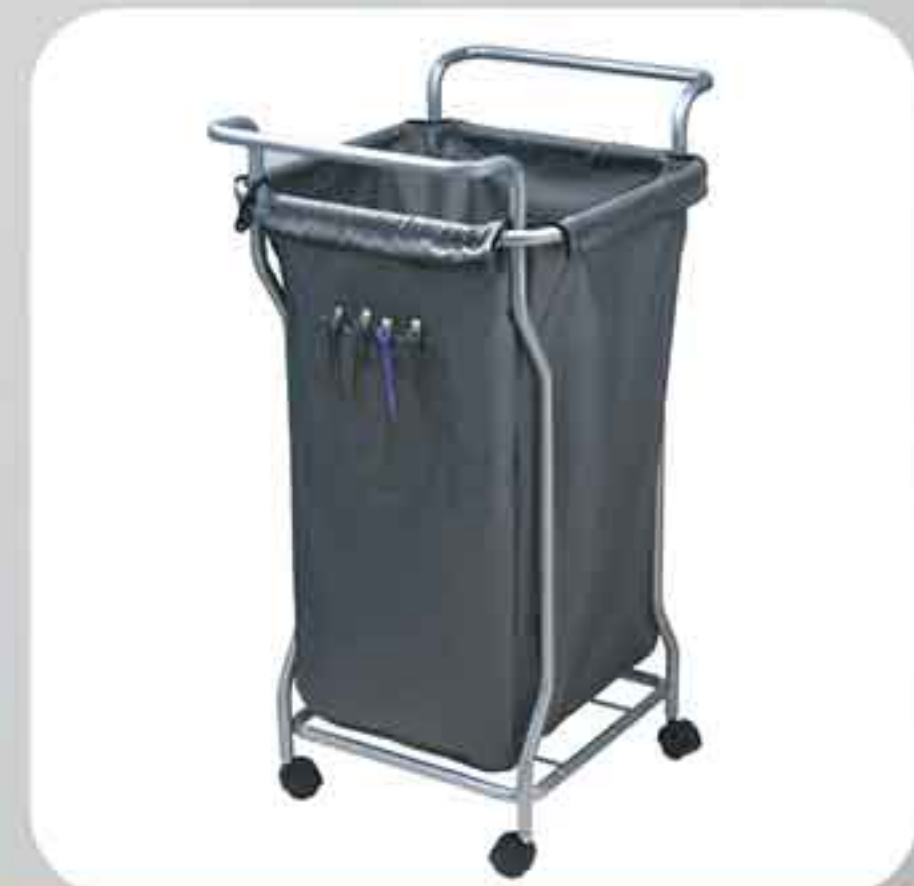
ΚΑΔΟΣ ΚΟΜΜΩΤΗΡΙΟΥ ΝΑ 0021