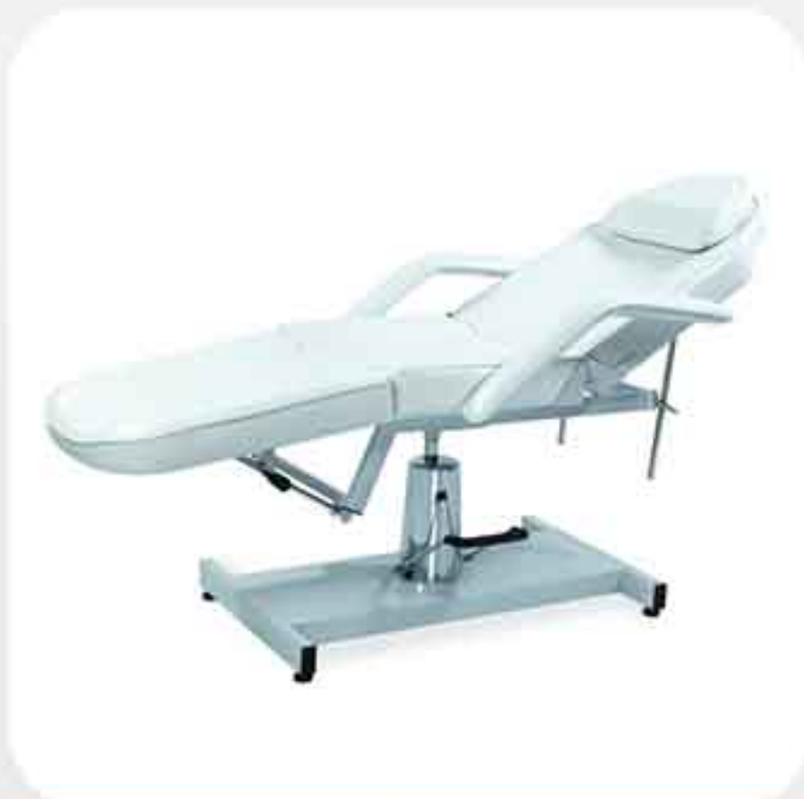
ΠΟΛΥΘΡΟΝΑ ΚΡΕΒΑΤΙ ΥΔΡΑΥΛΙΚΟ 3563