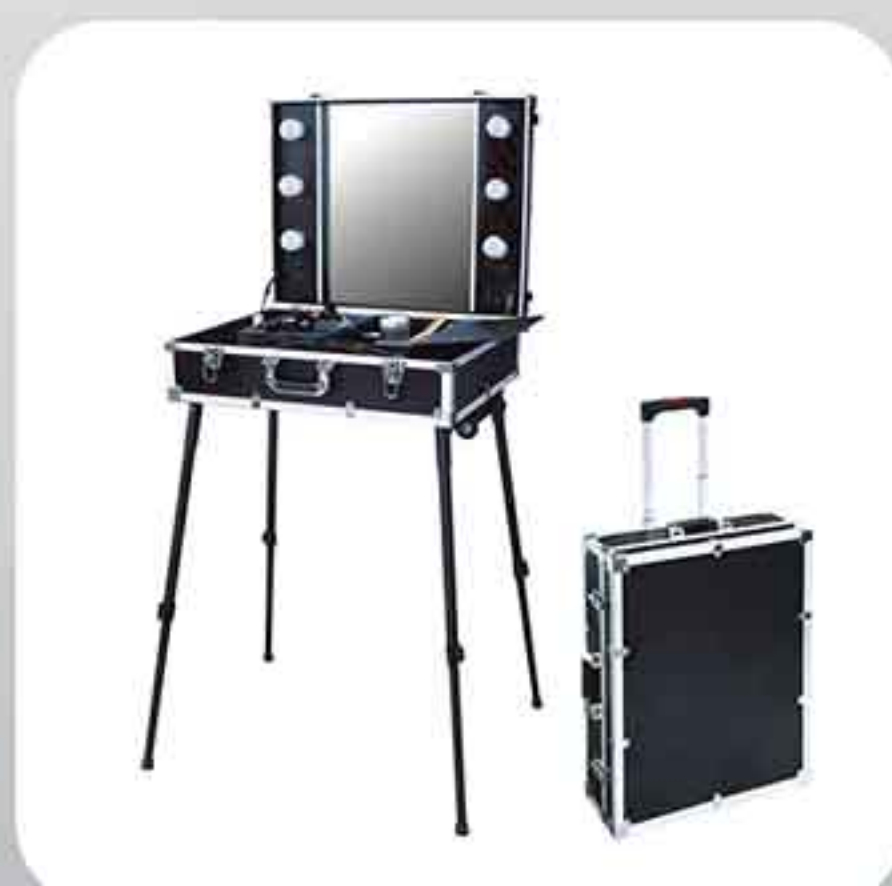
ΒΑΛΙΤΣΑ ΜΑΚΙΓΙΑΖ ΜΕ ΦΩΤΑ 1058