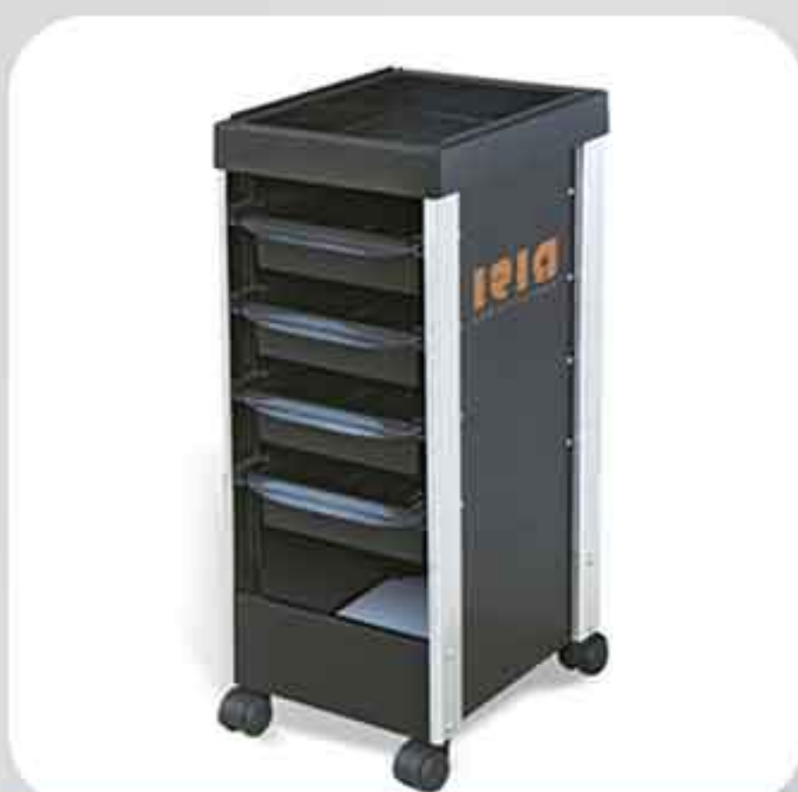
ΒΟΗΘΟΣ ΚΟΜΜΩΤΗΡΙΟΥ 16T