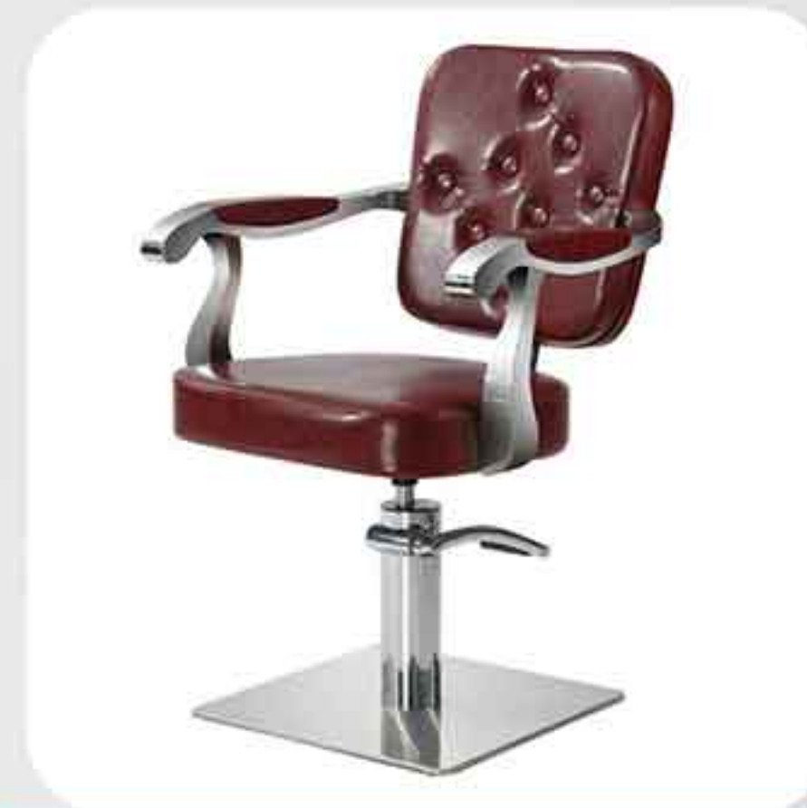
ΠΟΛΥΘΡΟΝΑ ΚΟΜΜΩΤΗΡΙΟΥ 6381