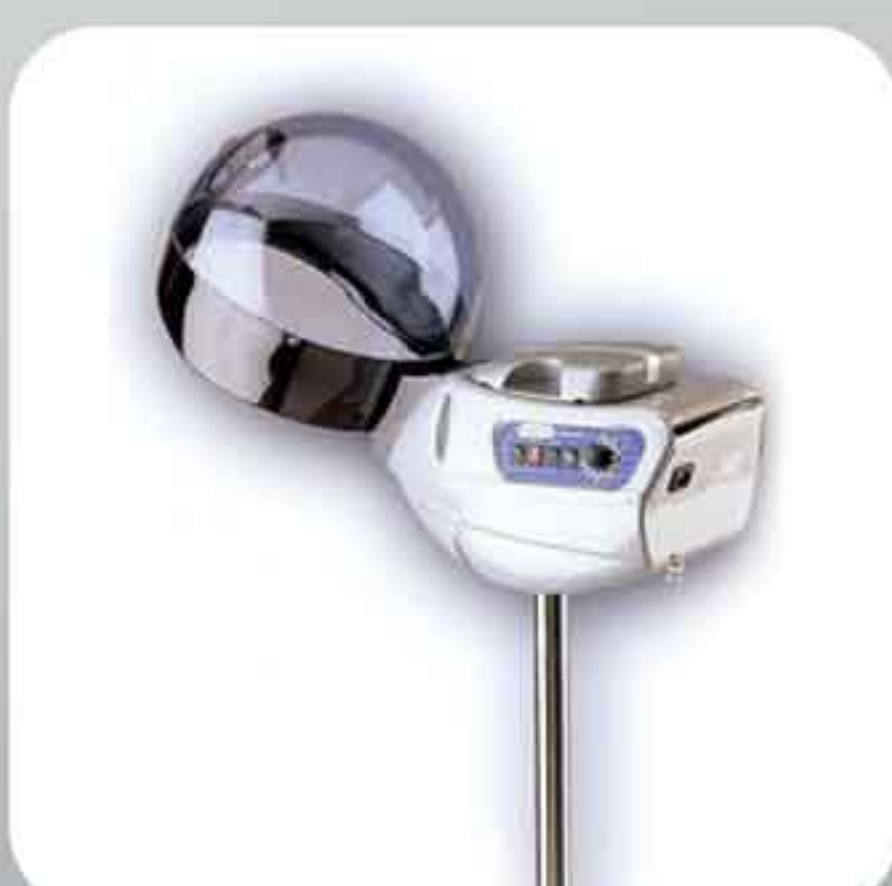
VAPEUR ME OZON VP0800