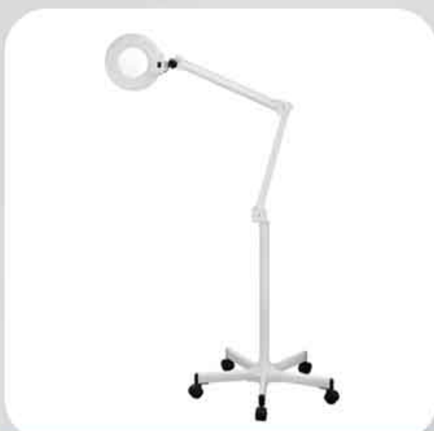
ΦΑΚΟΣ 1001A LED