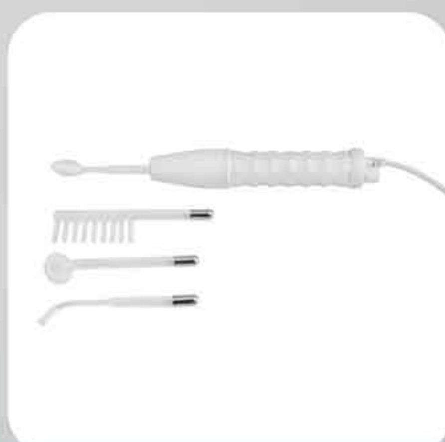
ΣΥΣΚΕΥΗ ΦΟΡΗΤΗ ΥΨΙΣΥΧΝΩΝ P-02