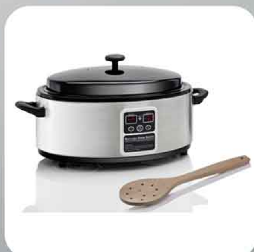
ΣΥΣΚΕΥΗ HOT STONE JUNIOR 350.101