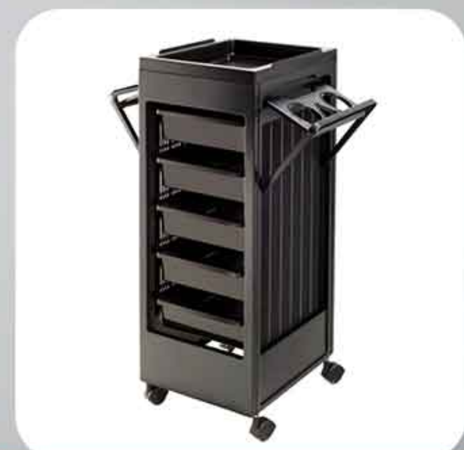
ΒΟΗΘΟΣ ΚΟΜΜΩΤΗΡΙΟΥ 94