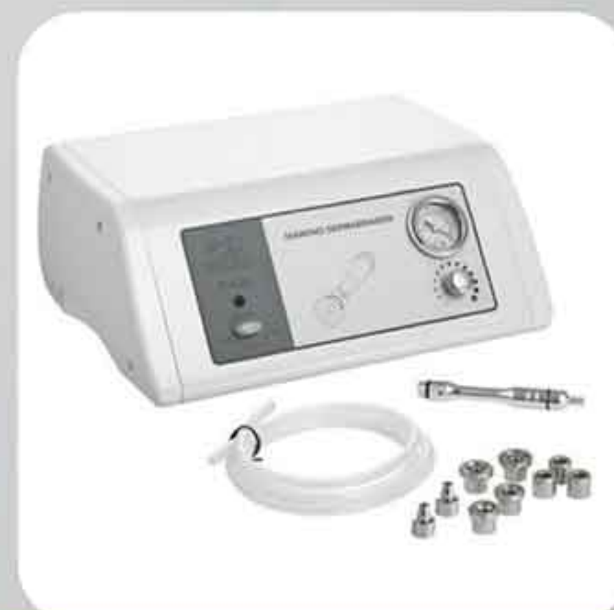
ΣΥΣΚΕΥΗ ΔΕΡΜΟΑΠΟΞΕΣΗΣ F-834