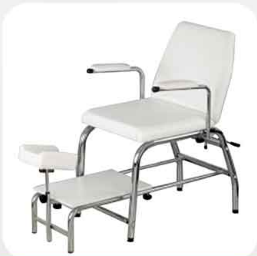
ΠΟΛΥΘΡΟΝΑ ΠΕΝΤΙΚΙΟΥΡ ΜΕ ΥΠΟΠΟΔΙΟ 539