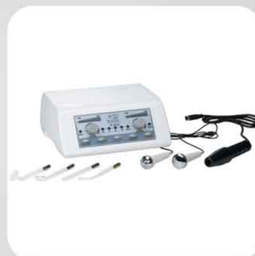
ΣΥΣΚΕΥΗ ΥΨΙΣΥΧΝΑ + ΥΠΕΡΗΧΟΣ F-812