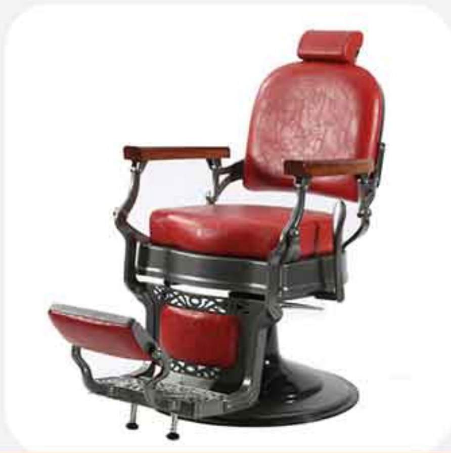
ΠΟΛΥΘΡΟΝΑ BARBER 31851-3 E1