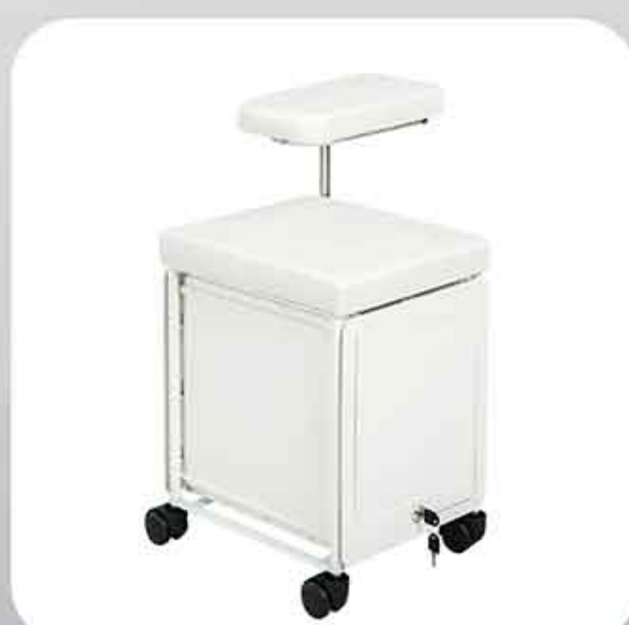
ΣΚΑΜΠΟ ΜΑΝΙΚΙΟΥΡ ΜΕ 3 ΣΥΡΤΑΡΙΑ QB0004