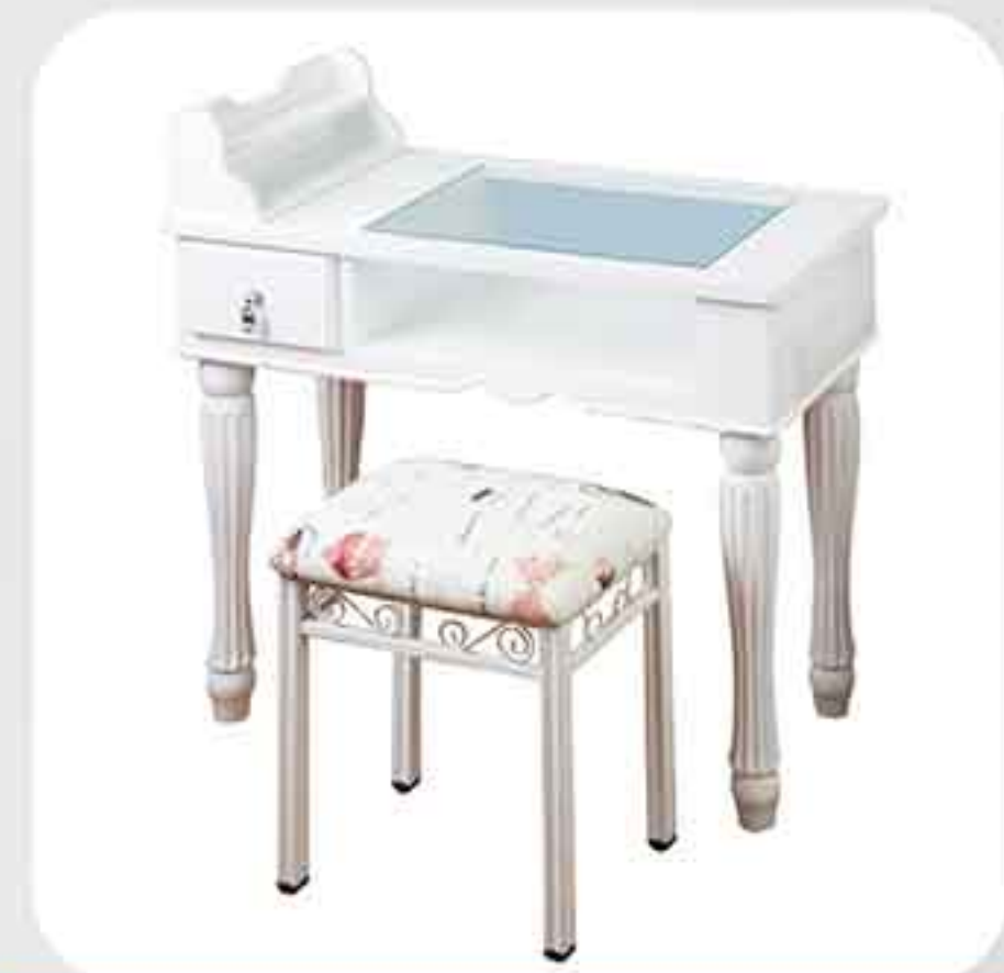
ΤΡΑΠΕΖΑΚΙ ΜΑΝΙΚΙΟΥΡ TABLE-14 ΣΚΑΜΠΟ CHAIR-06