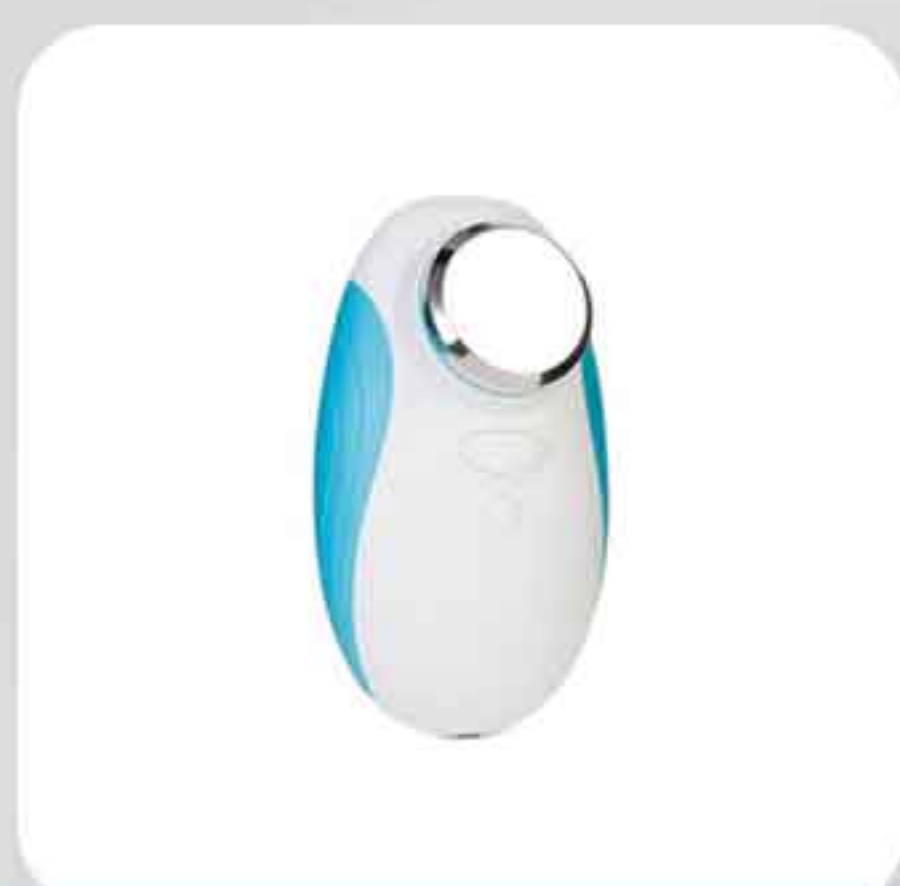
ΣΥΣΚΕΥΗ ΦΟΡΗΤΗ ΥΠΕΡΗΧΟΥ P-01