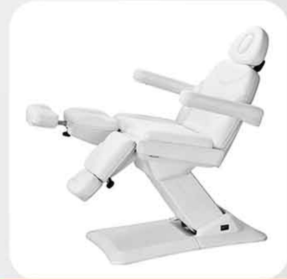
ΠΟΛΥΘΡΟΝΑ - ΚΡΕΒΑΤΙ ΗΛΕΚΤΡΙΚΟ 2235C