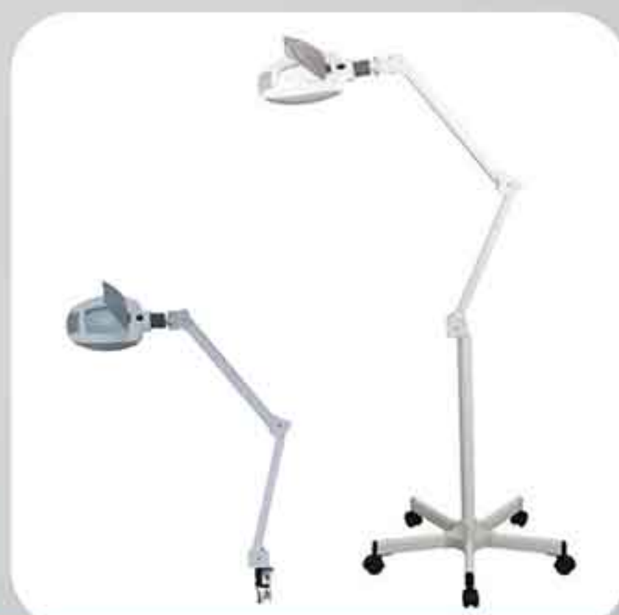
ΦΑΚΟΣ LED ΤΡΟΧΗΛΑΤΟΣ 1005 ΦΑΚΟΣ LED ΕΠΙΤΡΑΠΕΖΙΟΣ 1005T