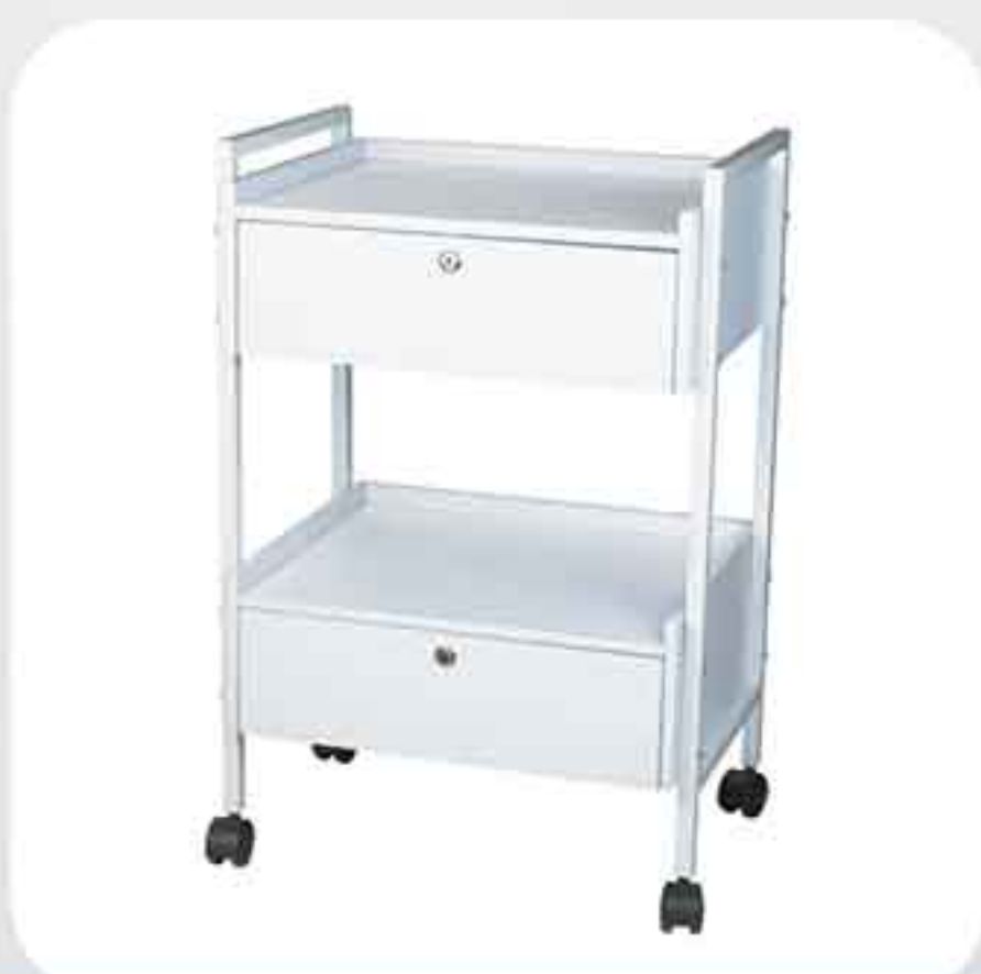
ΤΡΑΠΕΖΑΚΙ ΤΡΟΧΗΛΑΤΟ 2 ΡΑΦΙΑ - ΣΥΡΤΑΡΙΑ 1019