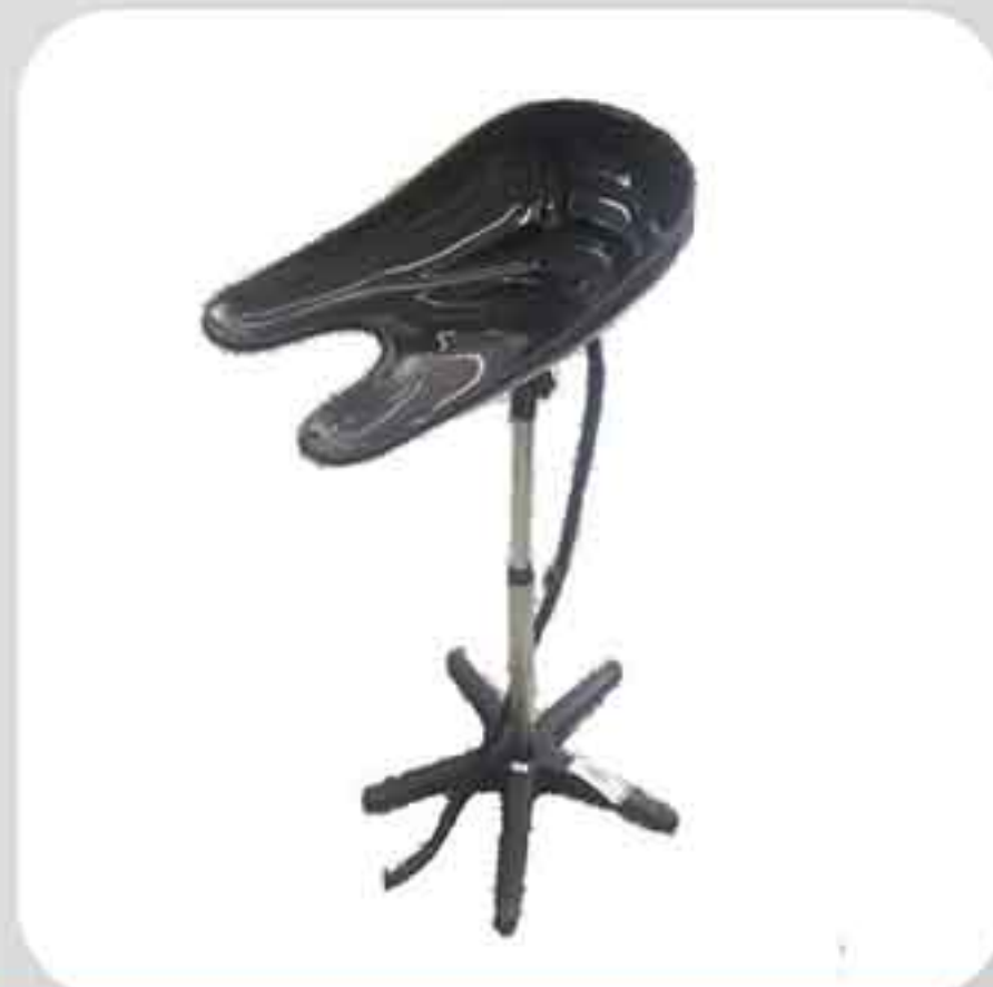
ΛΟΥΤΗΡΑΣ ΦΟΡΗΤΟΣ 4060