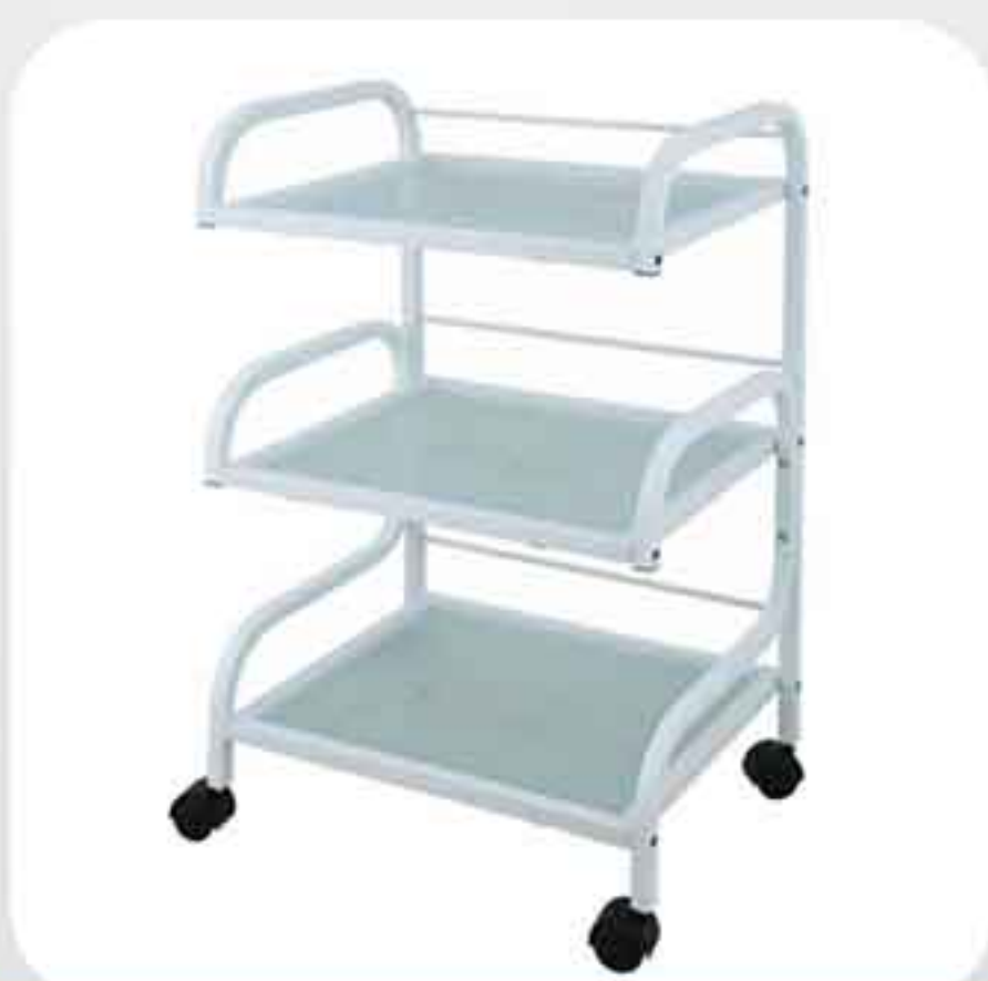
ΤΡΑΠΕΖΑΚΙ ΤΡΟΧΗΛΑΤΟ 1014