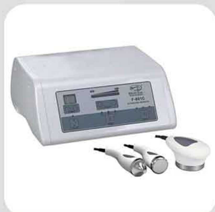
ΣΥΣΚΕΥΗ ΥΠΕΡΗΧΟΥ F-801C