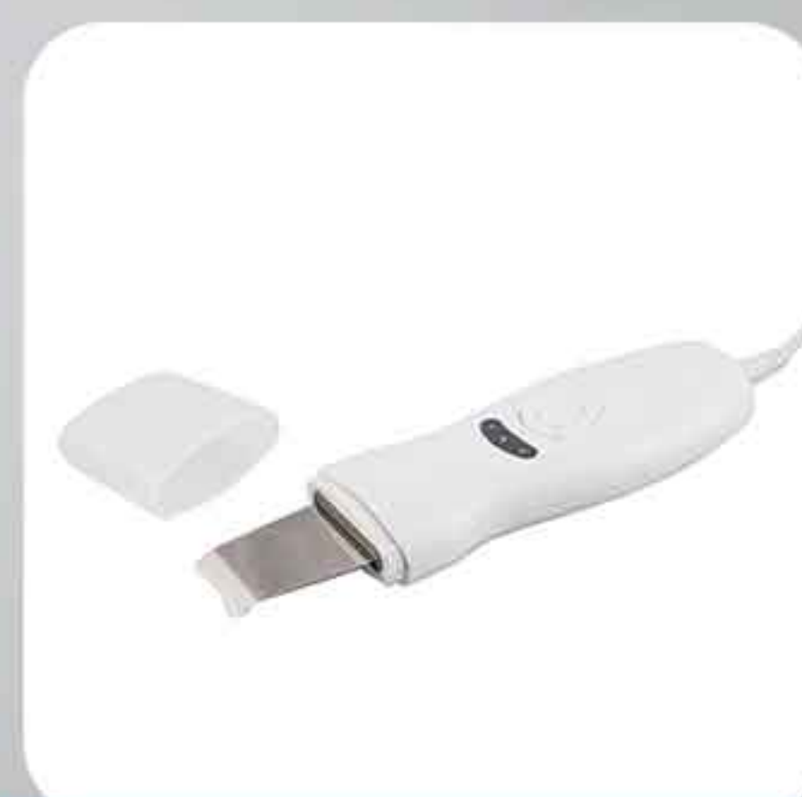
ΣΥΣΚΕΥΗ ΦΟΡΗΤΗ SKIN SCRUBBER P-03