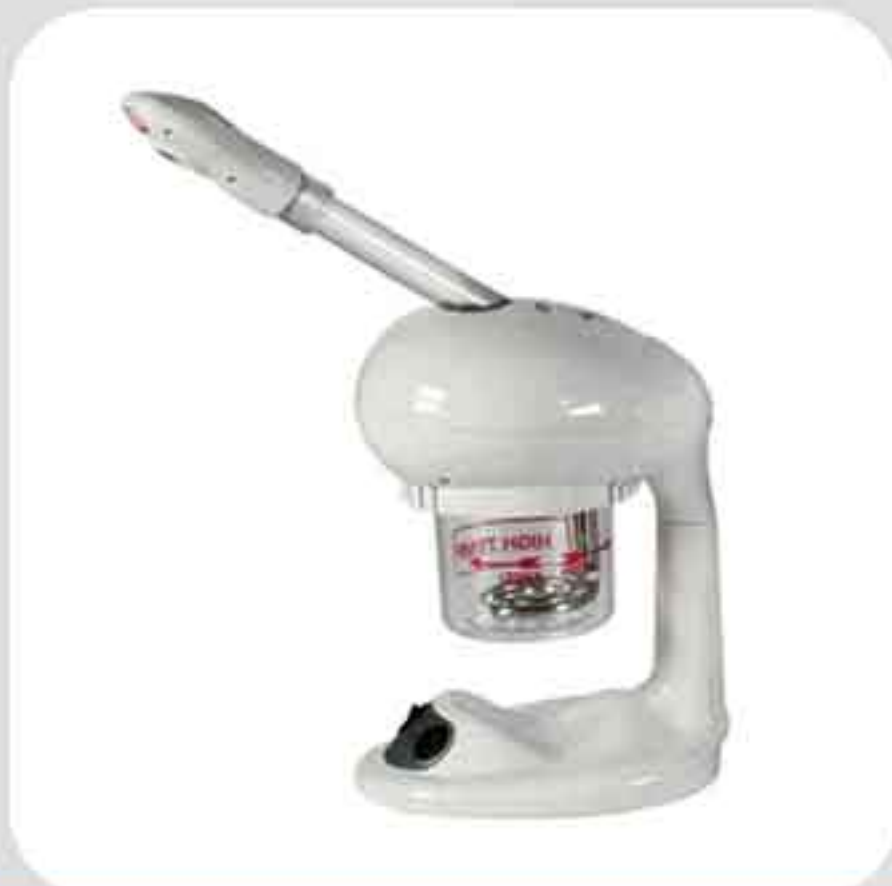
ΒΑΡΟΡΙΖΑΤΟΡ ΦΟΡΗΤΟ F-100C