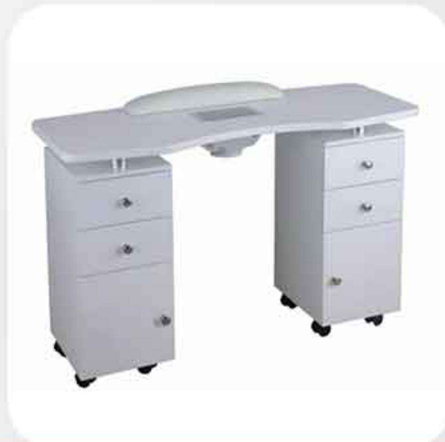
ΤΡΑΠΕΖΙ ΜΑΝΙΚΙΟΥΡ 60002B