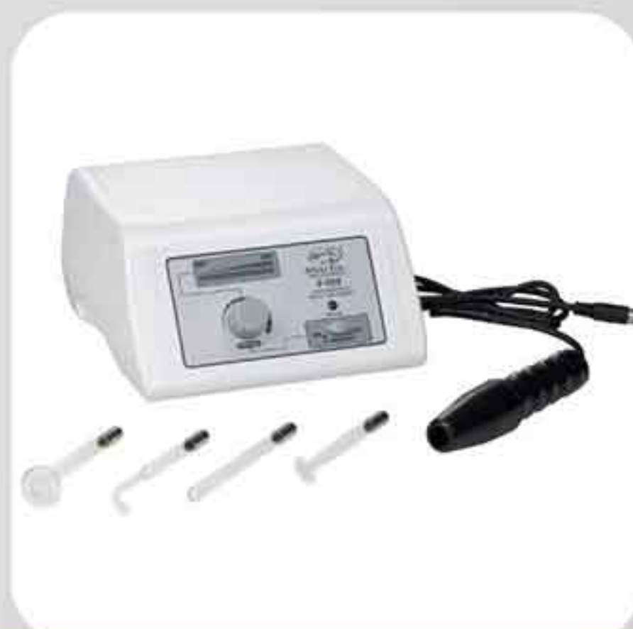
ΣΥΣΚΕΥΗ ΥΨΙΣΥΧΝΩΝ F-806