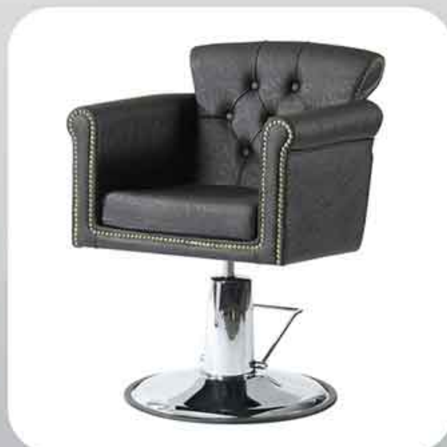
ΠΟΛΥΘΡΟΝΑ ΚΟΜΜΩΤΗΡΙΟΥ 6375