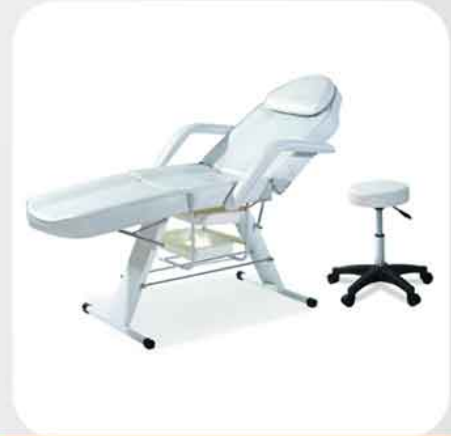
ΠΟΛΥΘΡΟΝΑ ΚΡΕΒΑΤΙ + ΣΚΑΜΠΟ 3558