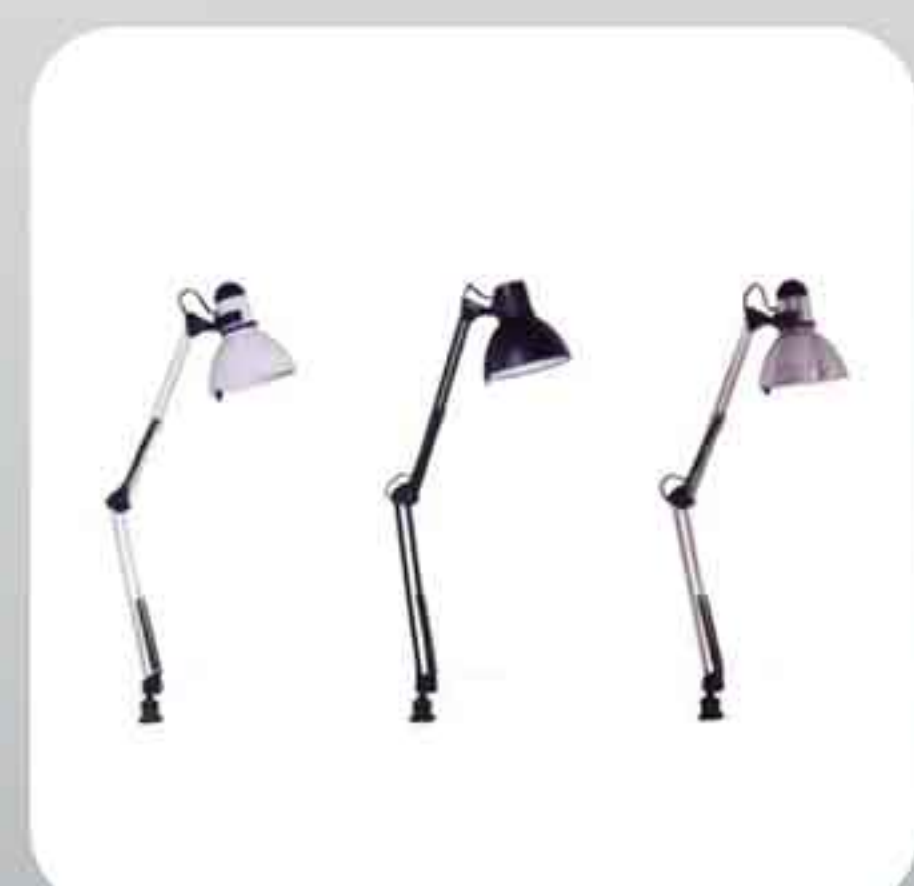
ΛΑΜΠΑ ΓΡΑΦΕΙΟΥ 10-19 SILVER-WHITE-BLACK