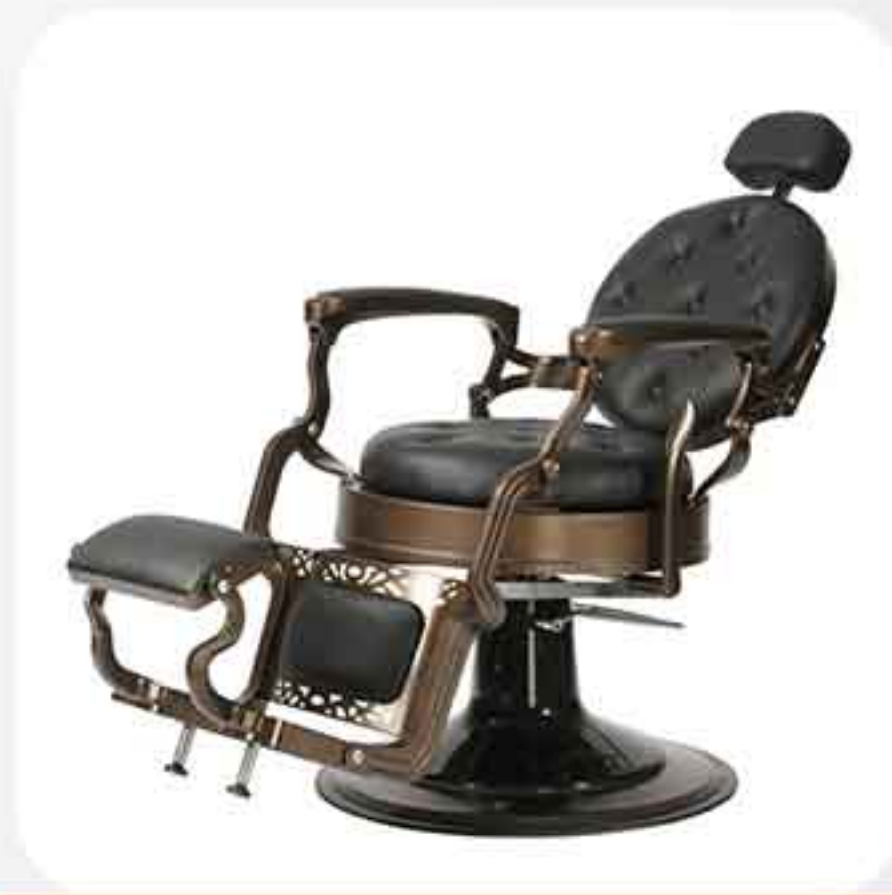
ΠΟΛΥΘΡΟΝΑ BARBER 31853-1-E1