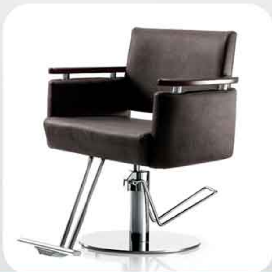
ΠΟΛΥΘΡΟΝΑ ΚΟΜΜΩΤΗΡΙΟΥ Y162