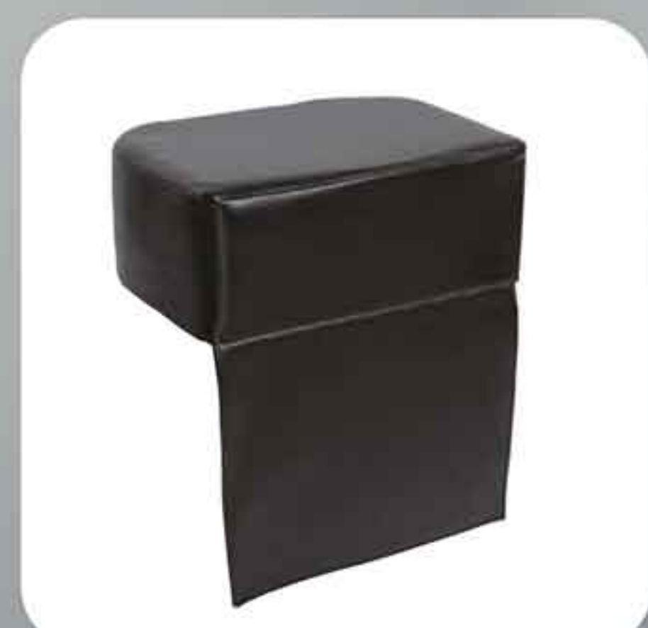
ΠΑΙΔΙΚΟ ΜΑΞΙΛΑΡΙ 9265