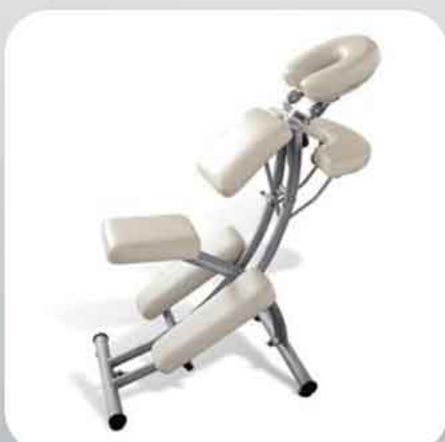
ΚΑΡΕΚΛΑ ΜΑΣΑΖ & ΤΑΤΤΟΟ NS 206Α