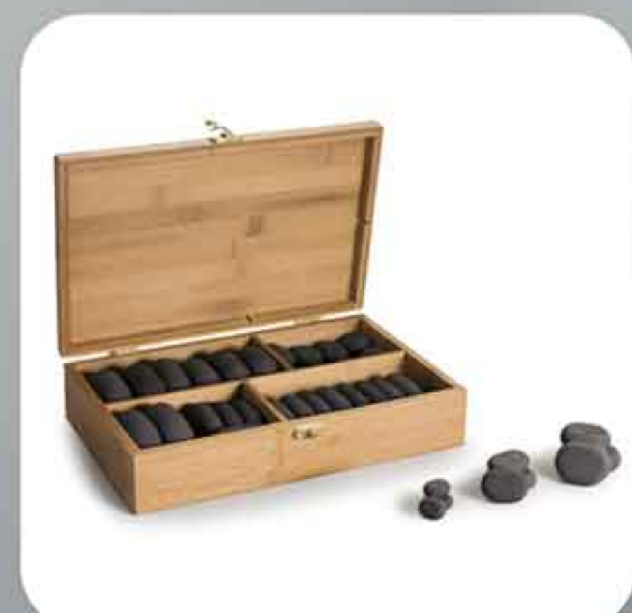
HOT STONE JUNIOR ΣΕΤ 350.102