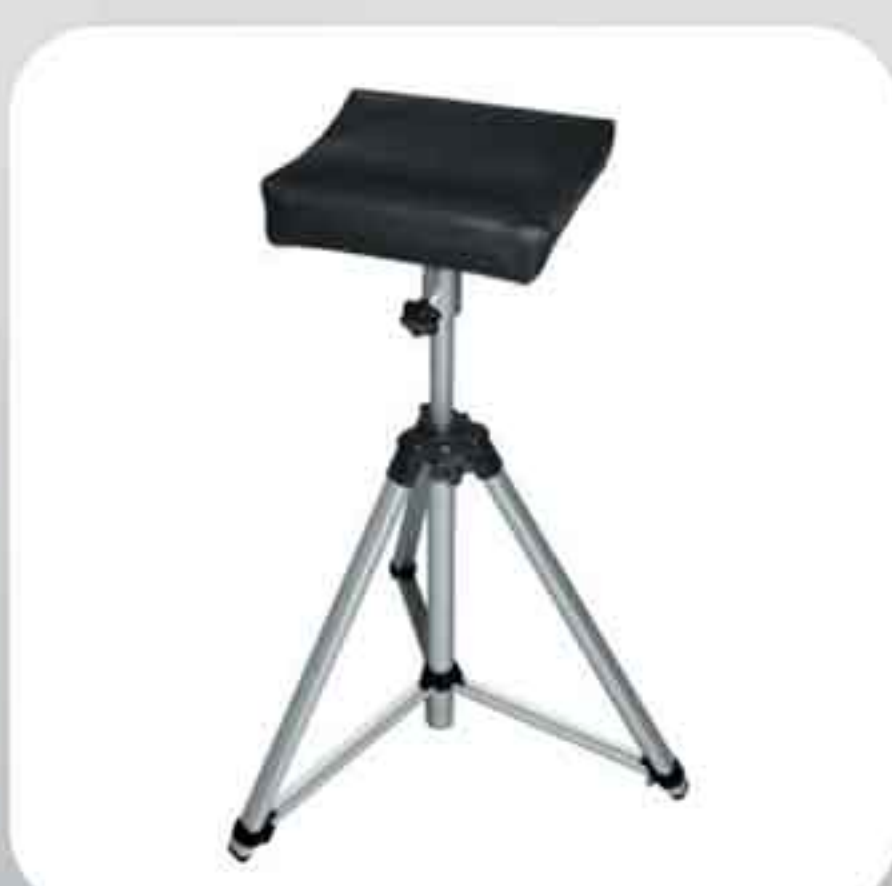
ΥΠΟΠΟΔΙΟ ΠΕΝΤΙΚΙΟΥΡ ΦΟΡΗΤΟ QB0002