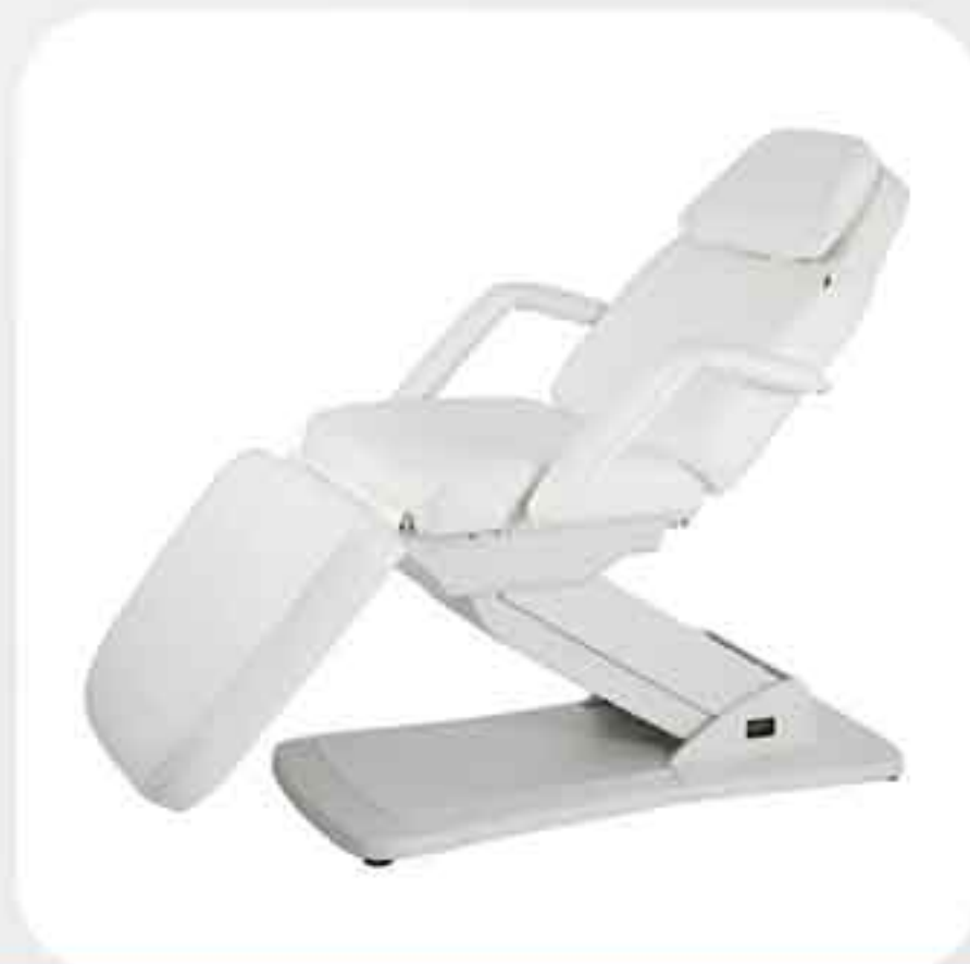
ΠΟΛΥΘΡΟΝΑ ΚΡΕΒΑΤΙ ΗΛΕΚΤΡΙΚΟ 2214Α