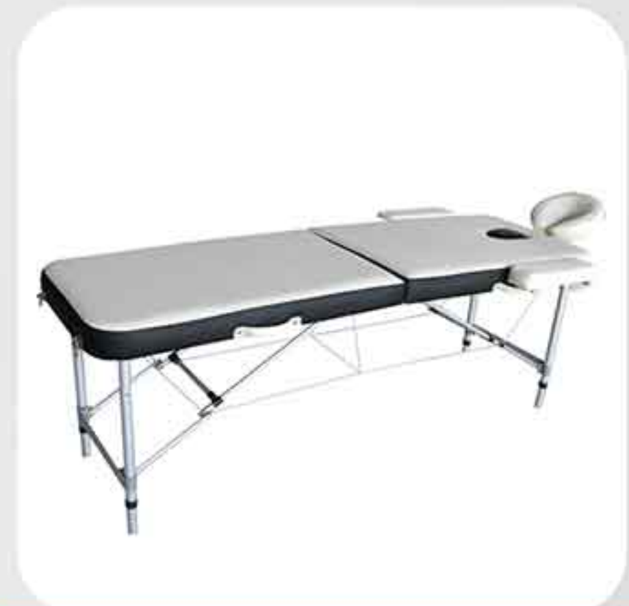
ΚΡΕΒΑΤΙ ΒΑΛΙΤΣΑ 3575