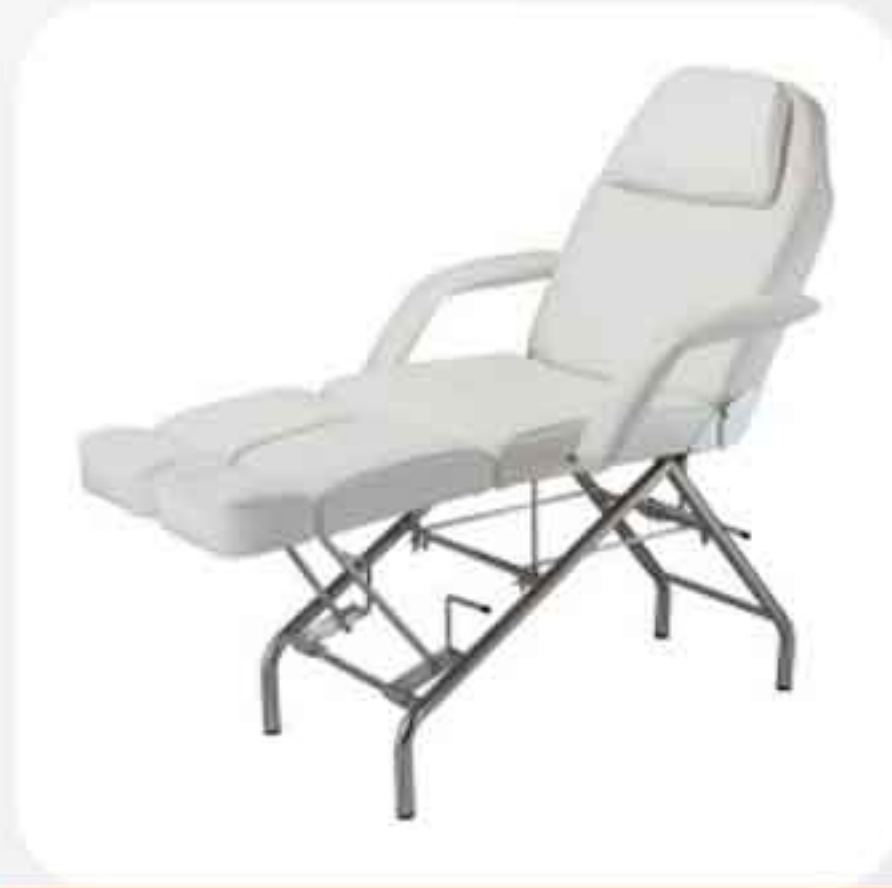
ΠΟΛΥΘΡΟΝΑ - ΚΡΕΒΑΤΙ ΠΕΝΤΙΚΙΟΥΡ 2201Α