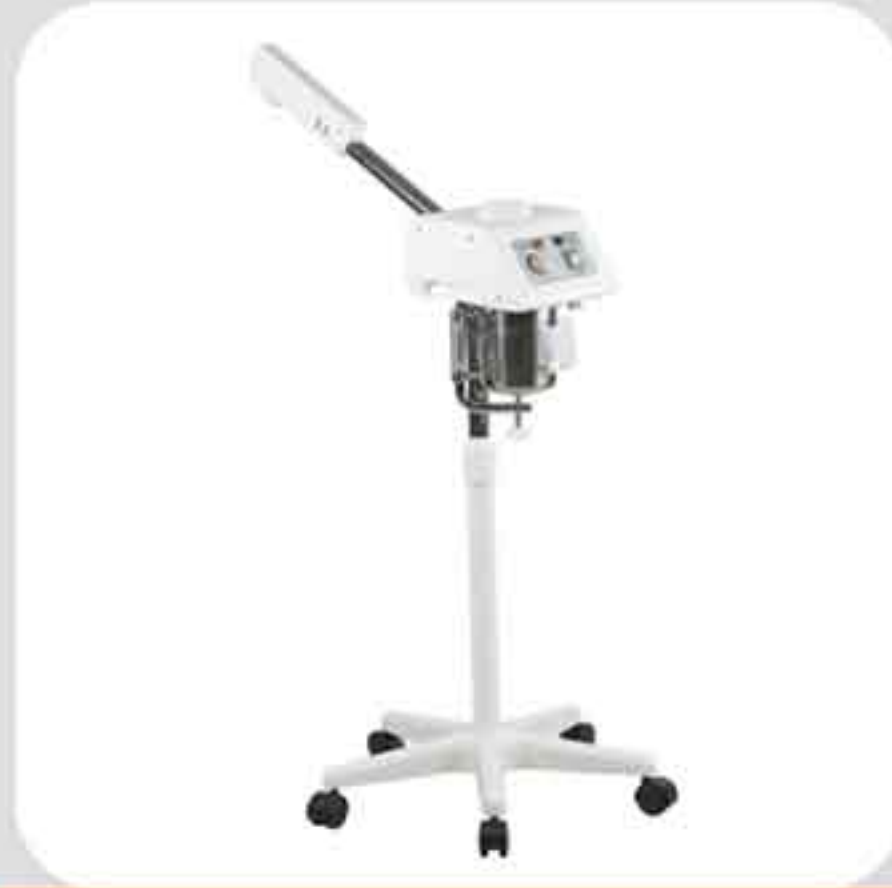
ΒΑΡΟΡΙΖΑΤΟΡ ΜΕ ΒΑΣΗ F-800A