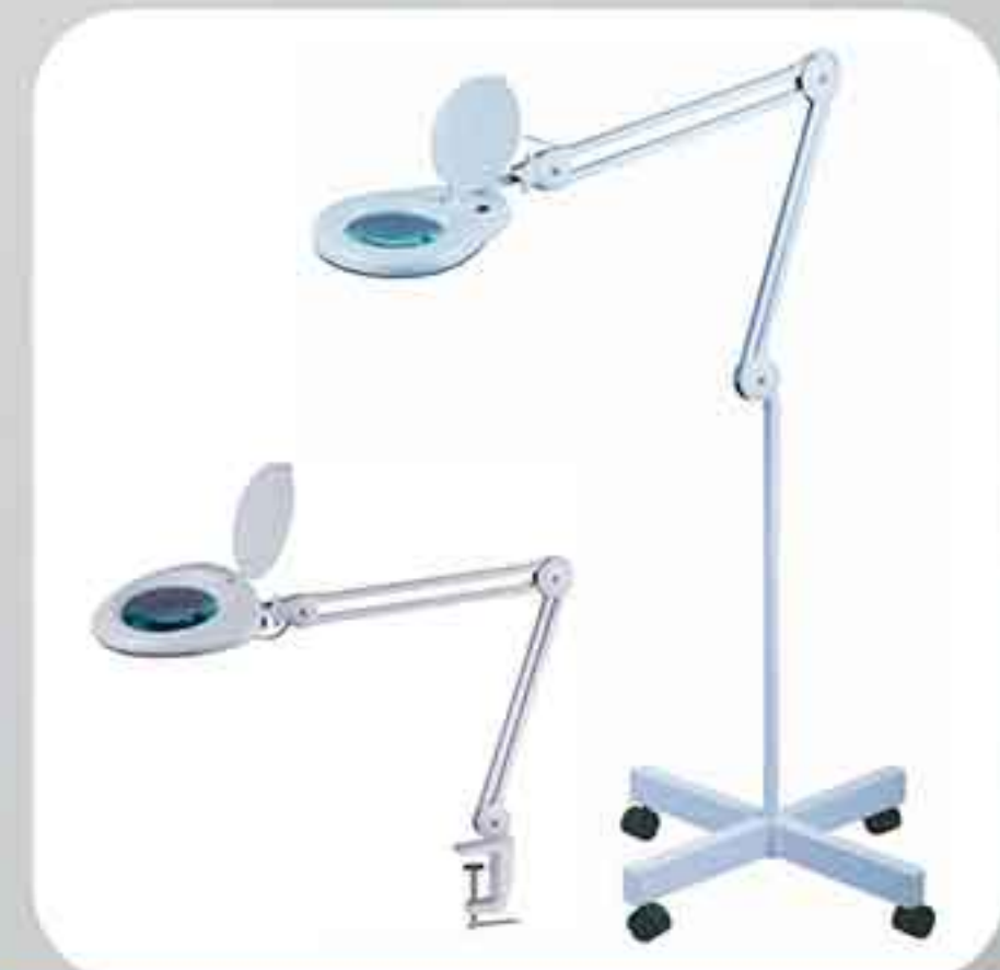
ΦΑΚΟΣ ΤΡΟΧΗΛΑΤΟΣ 6012-5 ΦΑΚΟΣ ΕΠΙΤΡΑΠΕΖΙΟΣ 6016