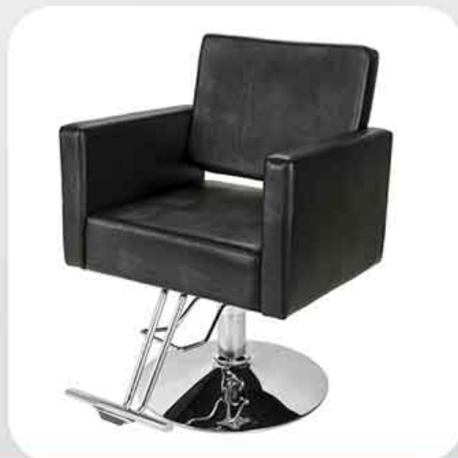
ΠΟΛΥΘΡΟΝΑ ΚΟΜΜΩΤΗΡΙΟΥ Y195