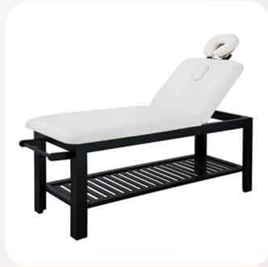
ΚΡΕΒΑΤΙ ΞΥΛΙΝΟ 2216