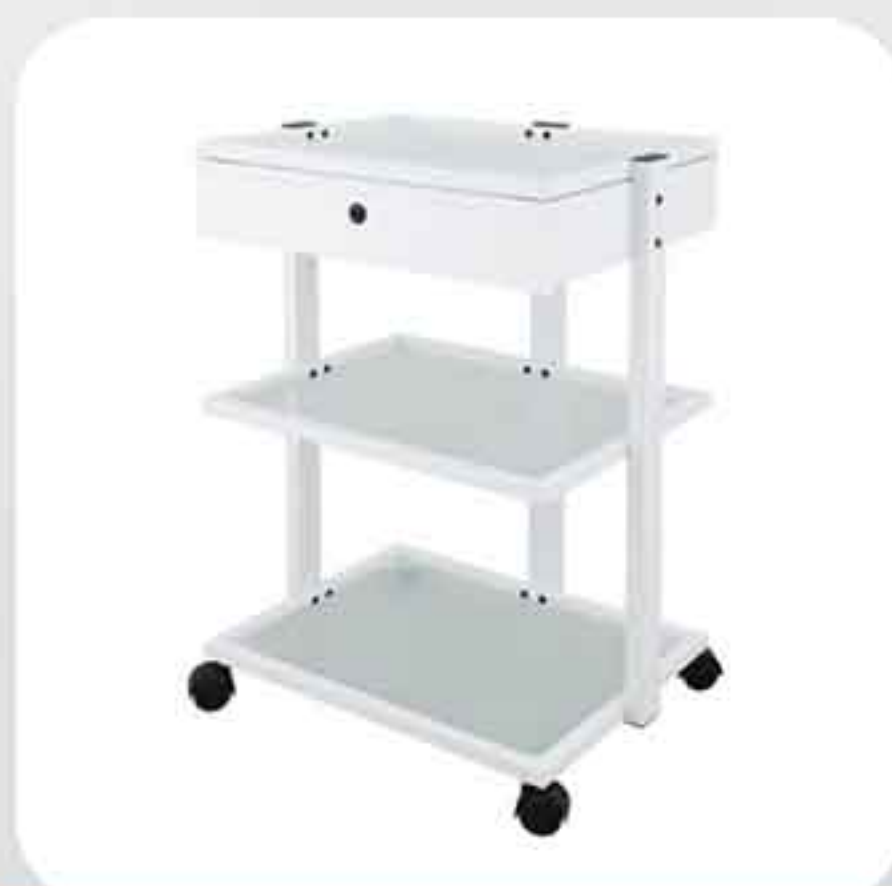
ΤΡΑΠΕΖΑΚΙ ΤΡΟΧΗΛΑΤΟ 1040Α