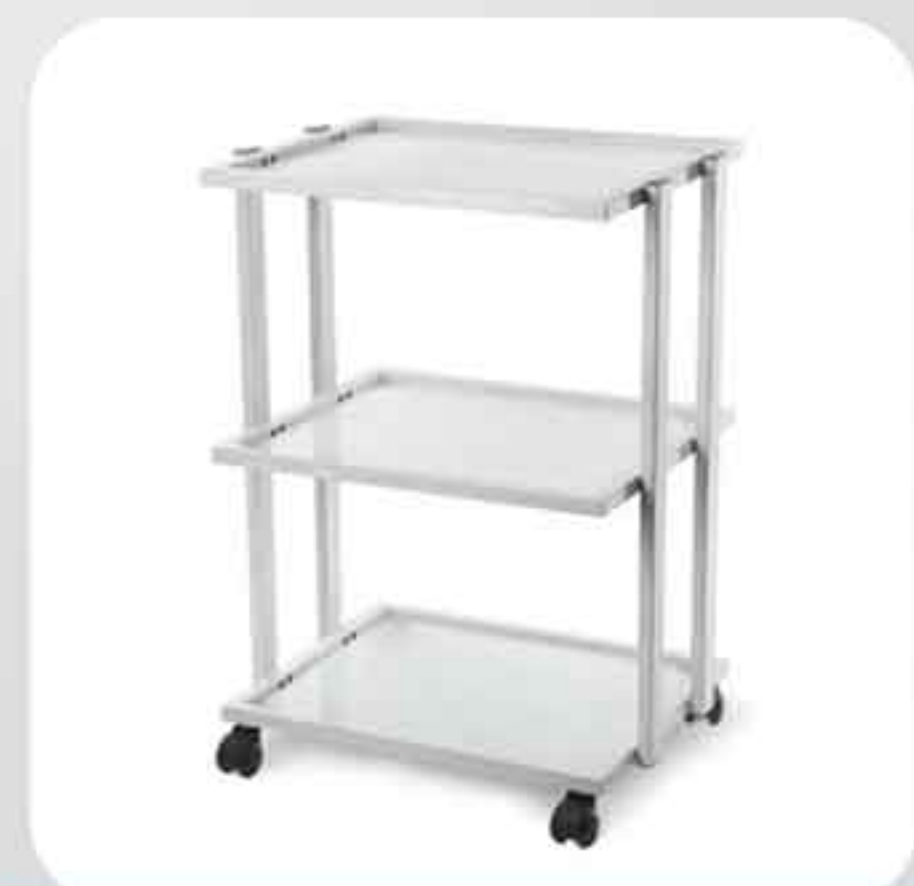
ΤΡΑΠΕΖΑΚΙ ΤΡΟΧΗΛΑΤΟ 3 ΡΑΦΙΑ 1041