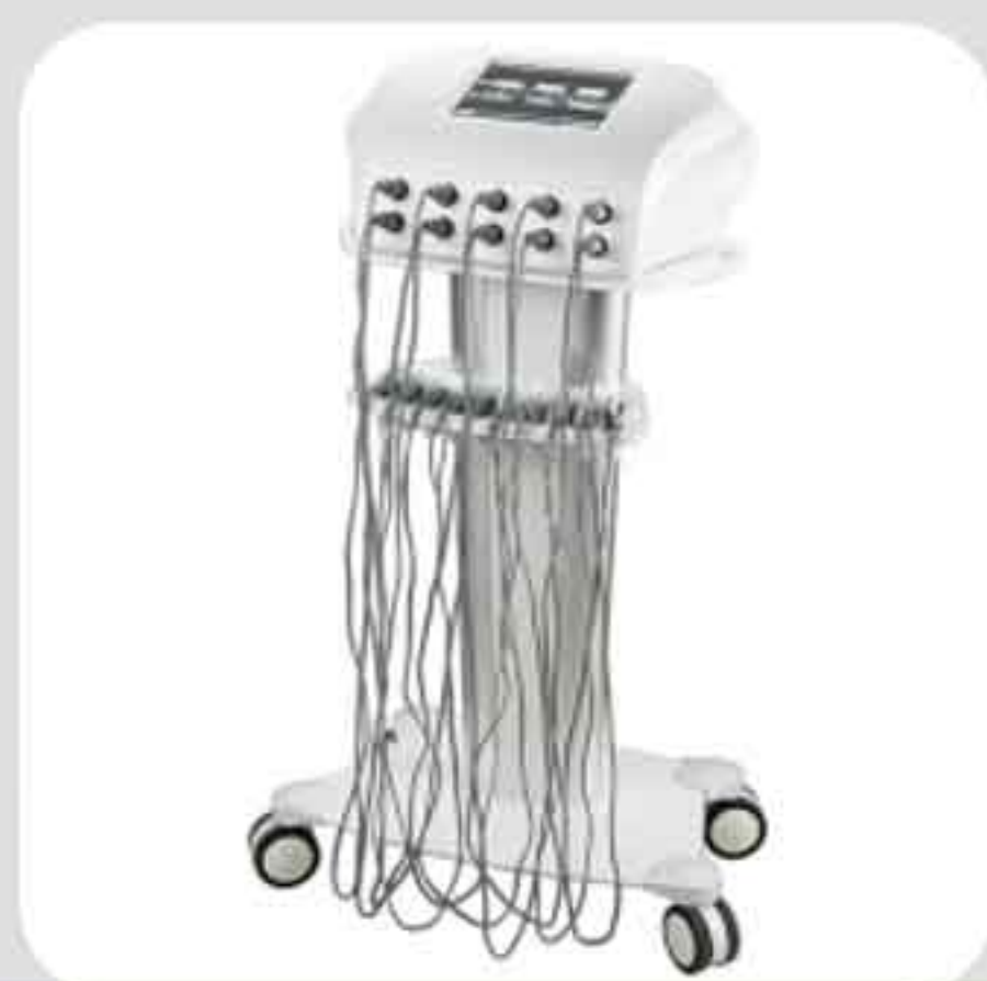
ΣΥΣΚΕΥΗ ΗΛΕΚΤΡΟΘΕΡΑΠΕΙΑΣ F-350