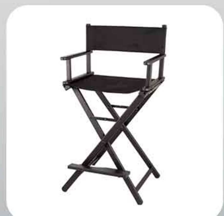
ΚΑΡΕΚΛΑ ΣΚΗΝΟΘΕΤΗ JL-009