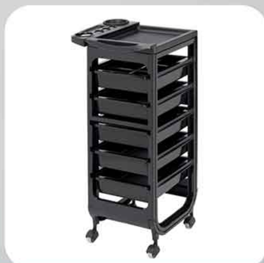
ΒΟΗΘΟΣ ΚΟΜΜΩΤΗΡΙΟΥ 271