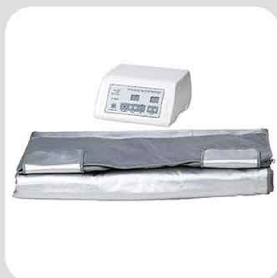
ΣΥΣΚΕΥΗ ΘΕΡΜΟΚΟΥΒΕΡΤΑ F-825