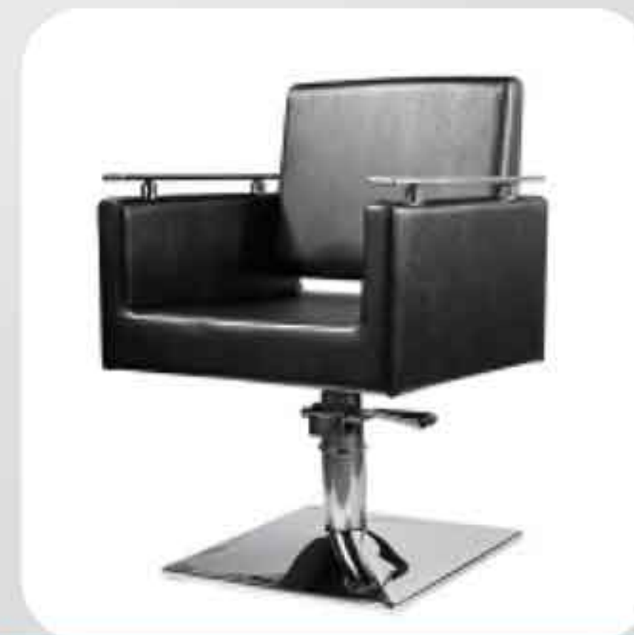
ΠΟΛΥΘΡΟΝΑ ΚΟΜΜΩΤΗΡΙΟΥ 6333-V5