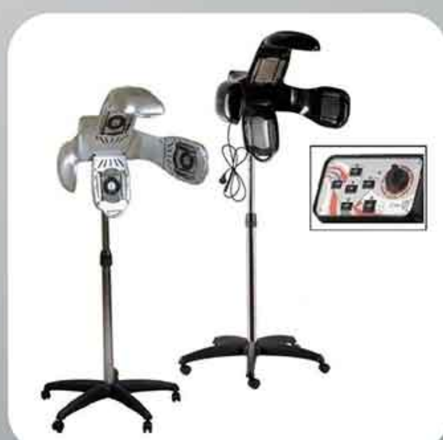
Climazon Harmony CLASS Με Βάση TSM1000 SILVER-BLACK