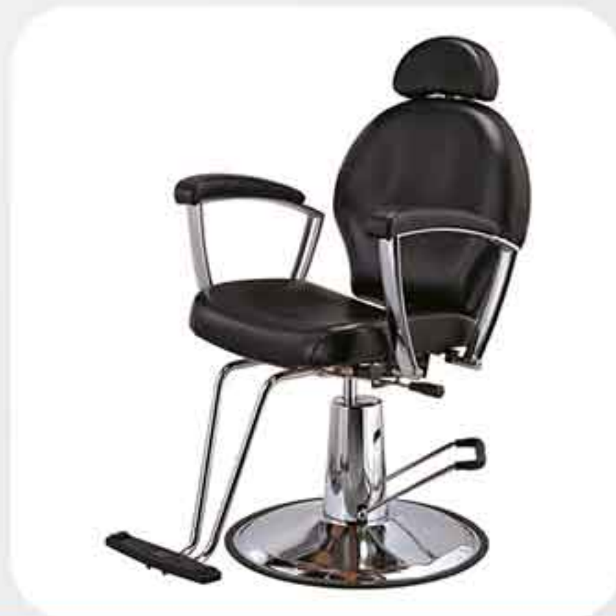
ΠΟΛΥΘΡΟΝΑ ΚΟΥΡΕΙΟΥ 31209