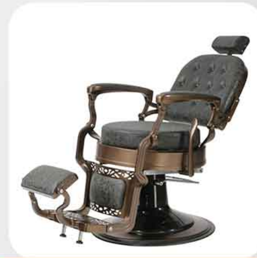
ΠΟΛΥΘΡΟΝΑ BARBER 31853-2-E1