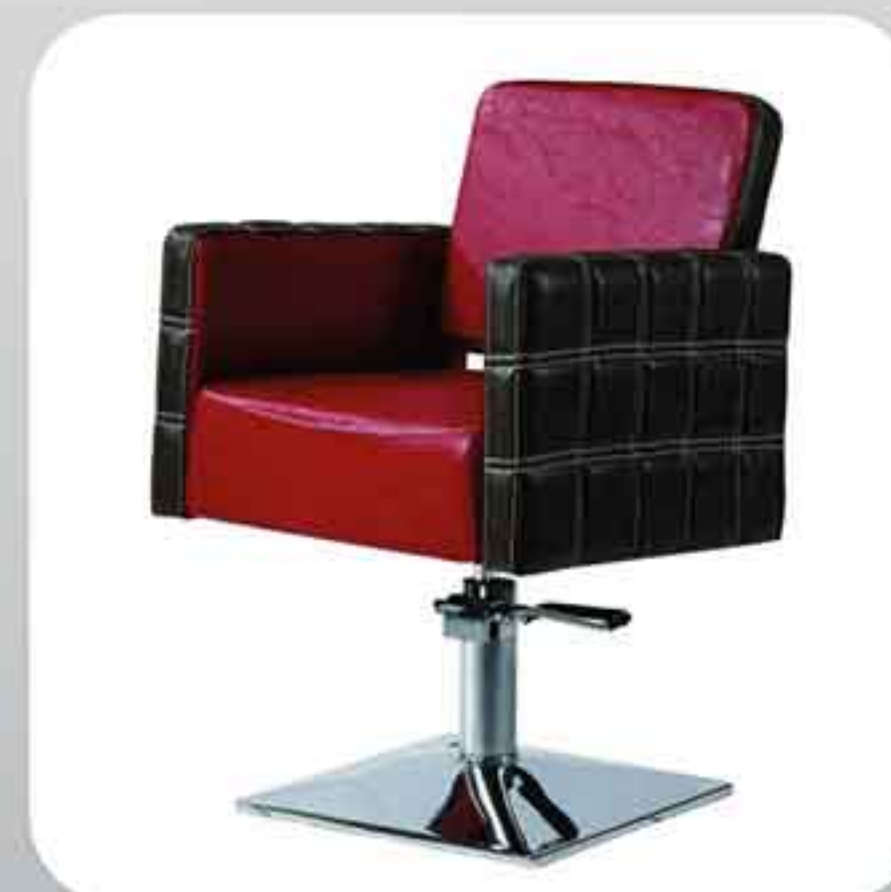
ΠΟΛΥΘΡΟΝΑ ΚΟΜΜΩΤΗΡΙΟΥ RED OR BLACK 2201-V5